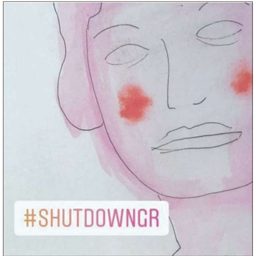
Las skizzas ein vegnidas creadas durant il «shutdown».