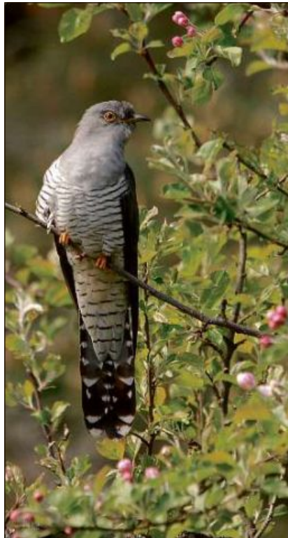
Per biars eis ei in eveniment, il cant dil cucu. Veser ei ei in'aventura.