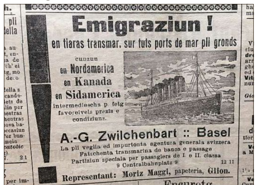
Inserat cumpariu ella «Gasetta Romontscha» igl onn 1920.