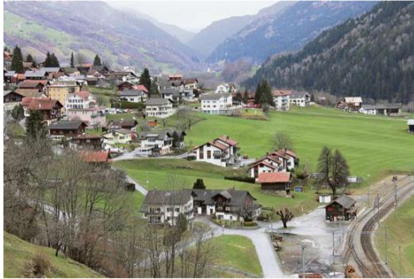
Elia vischinonza dalla staziun dalla Viafier retica a Rabius duei vegnir erigiu habitaziuns per persunas el process da lavur.

persunal stagional e persunal ch'ei sur onn engaschau els secturs commerzi, turissem e sanadad. «Sumvitg ei l'emprema vischnaunca ch'introducescha ina tala zona nova», constatescha il president communal e di: «Ils criteris che han da