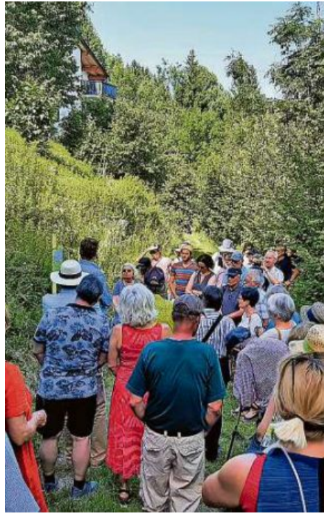
Fermada ella Senda Hans Moser.