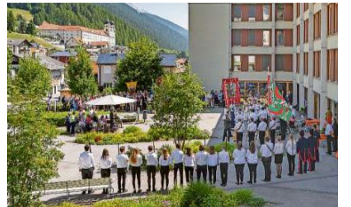
La processiuon dalla fiasta da sogn Gion Battesta a Mustér ha menau entuorn il quartier da Dulezi per ir a fin sil plaz avon la casa Puntreis.

La pleiv catolica da Mustér senumna Pleiv sogn Gions. Ils Gions ein pia numnai en plural. La fiasta vegn festivada pil di da sogn Gion Battesta, quel ch'ei ius ordavon a Jesus e ha annunziu il messias als avdents dalla Giudea. El ha battegiu Cristus ell'aua dil Jordan. Gion Battesta vala sco davos profet digl advent e ha viviu il medem temp sco Jesus Cristus. Savens vegn el mussaus en malets e statuas sulet cun siu tgaun. Sia mort tragica ei tenor la legenda la scavazzada sin giavisch dalla dunna da Herodes per in sault ch'il despot ha giavischau dad ella. Quei stat scret els evangelis da Marcus e Mattiu.