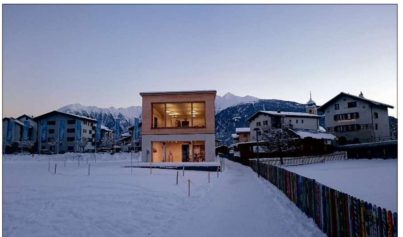
La Cularta ella glisch dalla sera. Davostier la Cadeina dil Signina, il vitg ed il clutger dalla baselgia.

La Cularta a Laax ei aviarta mintgamai gievgia, vendergis, sonda e dumengia dallas 15.00 tochen allas 18.00. Ulterioras informaziuns mira www.cularta.ch