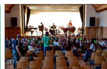
Gronda concentraziun d'urants las provas da registers.