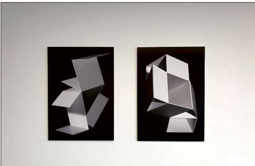
Theres Jörger ha collaborau culla fotografa Susanne Stauss per quella grafica el stil «fine-art-print».