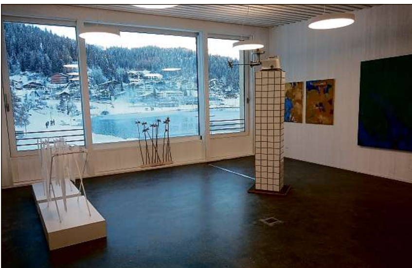
Negin sesenta serraus en – ed era buc ora: La galleria ei in spazi aviert e clar.