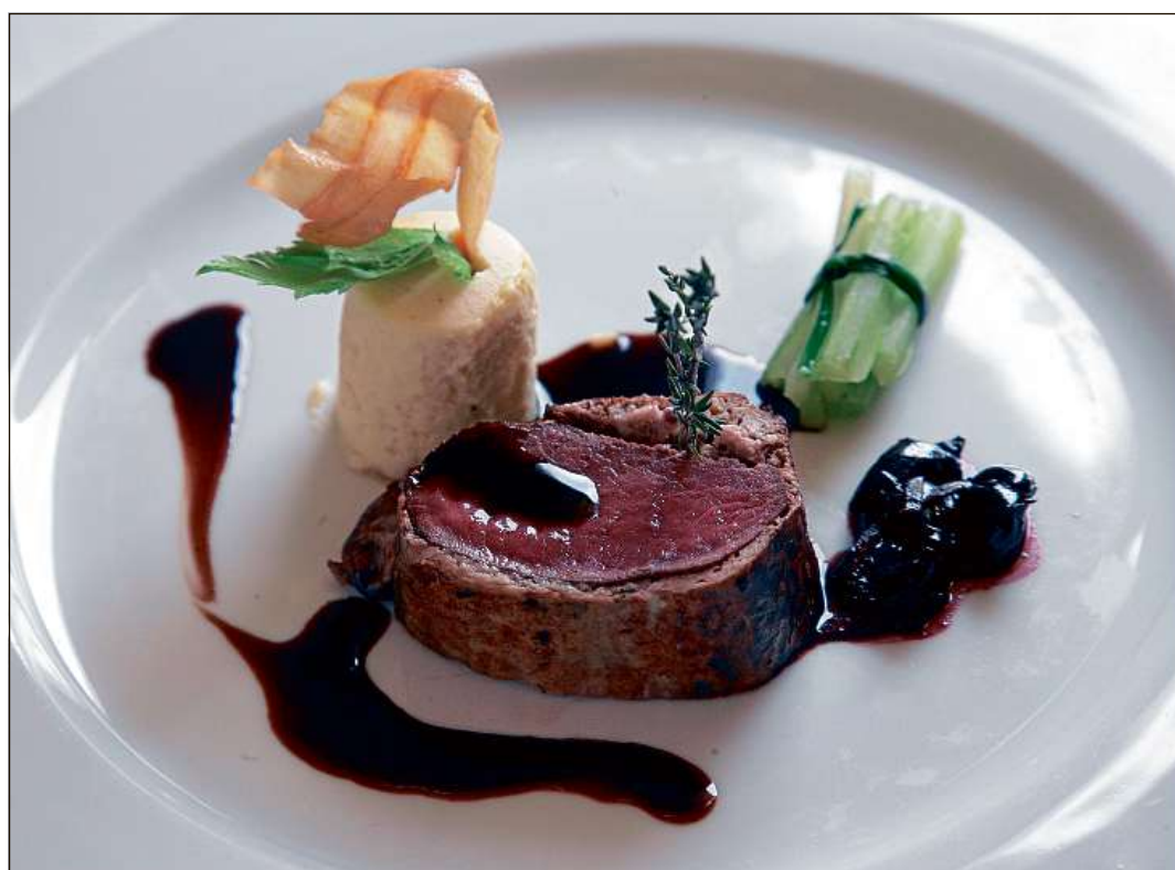
Ozendi han ils cuschiniers d'esser flexibels ed era cuschinar tratgas senza lactosa e gluten.

■ En la gastronomia è flexibilitad in'obligaziun per ademplier mintga giavisch dals giasts. Gist quai che pertutga la cuschina en ils ultims onns las sfidas daventadas pli grondas. La raschun è ch'adina dapli giasts han allergias e na verteschjan betg blers products. Las davosas duas emnas han ils restaurants en las destinaziuns da vacanzas grischunas lavurà fitg bain. Igl è vegnì consumà pulit, mangià be il pli bun e vitiers è er vegnì cuschinà tenor giavisch. Ozendi è quai indispensabel per mintga restaurant ed hotel cun esser ils giasts adina pli pretensius ed allergics sin numerusas victualias e products da latg e farina. Sin 80 giasts han almain diesch giavischs spezial, saja quai cun esser intolerants da lactosa, be mangiar products senza gluten, cun esser vegetarians, vegans e flexetarians. Bliers giasts en lura er allergics cunter nitscholas, tschagula e numerusas spezialas. Quai vul dir ch'en mintga cuschina da restaurants ed hotels