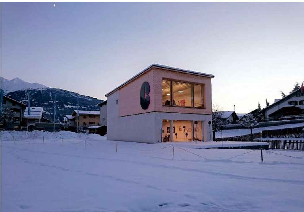
La Cularta semeglia ina staziun d'ina pendiculara. Igl ei denton ina staziun digl art.